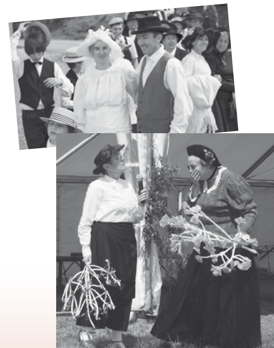
Gien-sur-Cure Juillet 2011