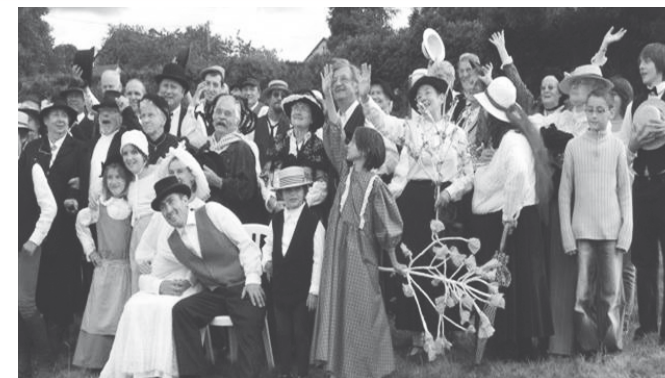
Gien-sur-Cure Juillet 2011