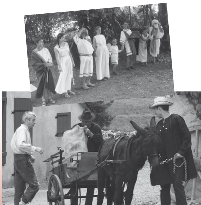
Gien-sur-Cure Juillet 2011

La réalisation de cette fête a lieu grâce à la disponibilité et les bonnes volontés de chacun, permettant ainsi les échanges entre les habitants des différentes communes.